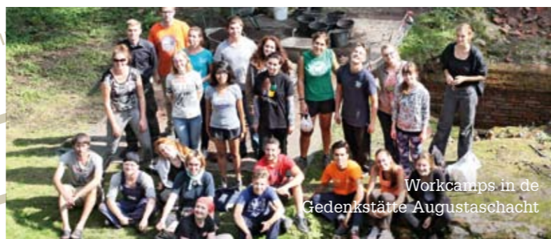
Workcamps in de Gedenkstätte Augustaschacht