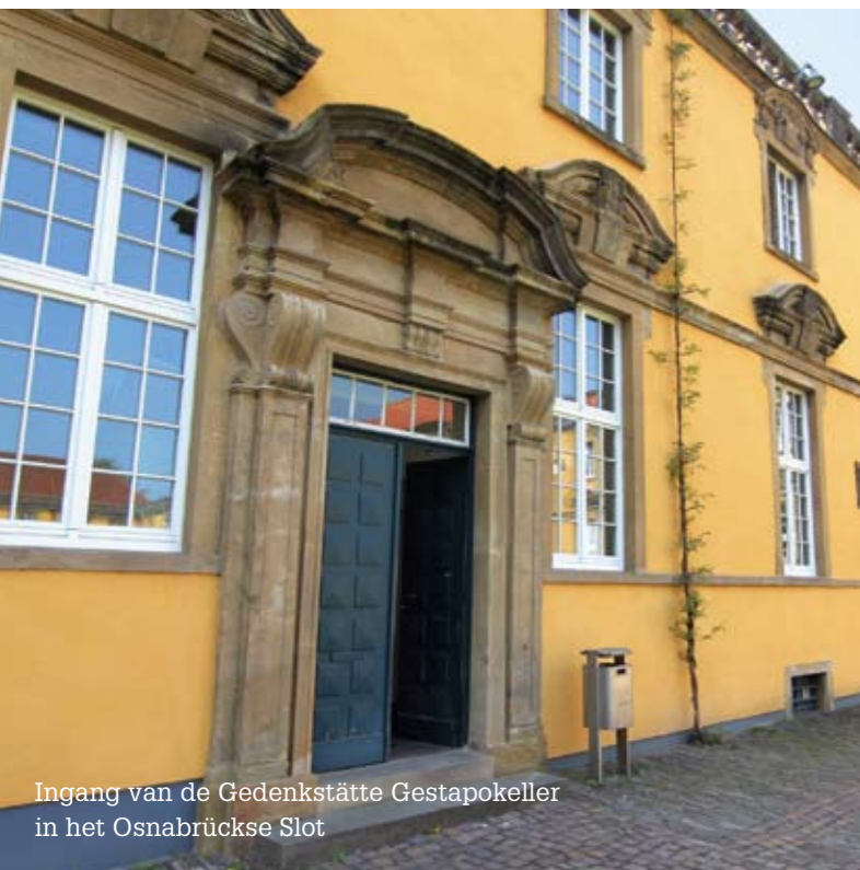
Ingang van de Gedenkstätte Gestapokeller in het Osnabrückse Slot

Gedenkstätten Gestapokeller und Augustaschacht e.V. Zur Hügelschlucht 4 49 205 Hasbergen-Ohrbeck Duitsland Tel. + 49 (0) 54 05 / 8 95 92 70 info@augustaschacht.de www.gedenkstaetten-augustaschacht-osnabrueck.de