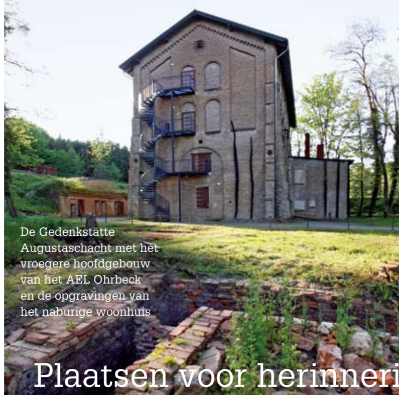
De Gedenkstätte Augustaschacht met het vroegere hoofdgebouw van het AEL Ohrbeck en de opgravingen van het naburige woonhuis

■ Beide gedenkplaatsen herinneren aan de controle, de terreur en het geweld van de Gestapo in het grensgebied met Nederland. Hier krijgen de slachtoffers een gezicht en stem en worden de daders aangewezen. Door middel van tentoonstellingen en educatieve projecten kunnen bezoekers zelfstandig op onderzoek uit of gezamenlijk iets leren over het verleden. De gedenkplaatsen kunnen afzonderlijk worden bezocht of in een zelf gekozen volgorde.