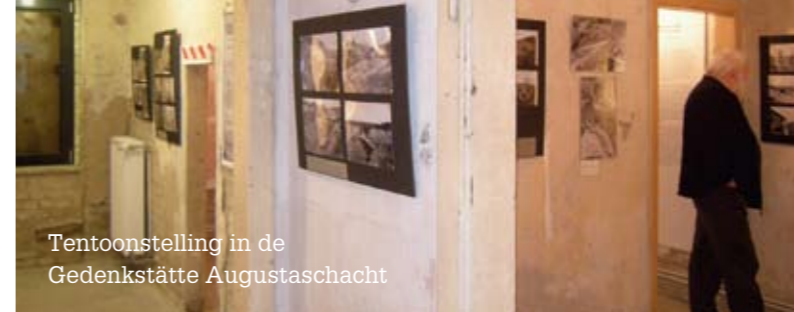
Tentoonstelling in de Gedenkstätte Augustaschacht