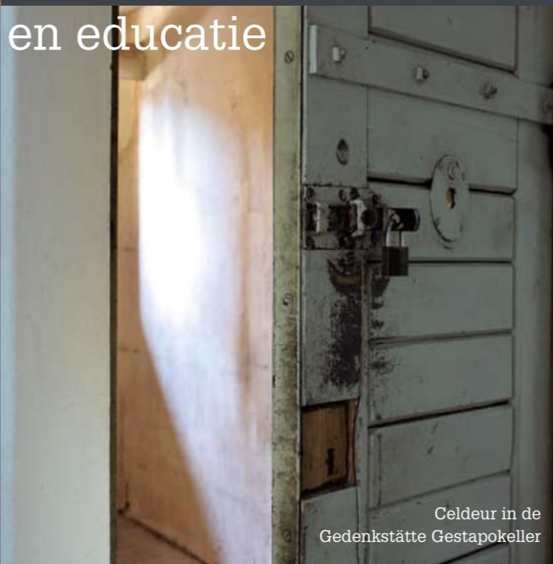
Celdeur in de Gedenkstätte Gestapokeller