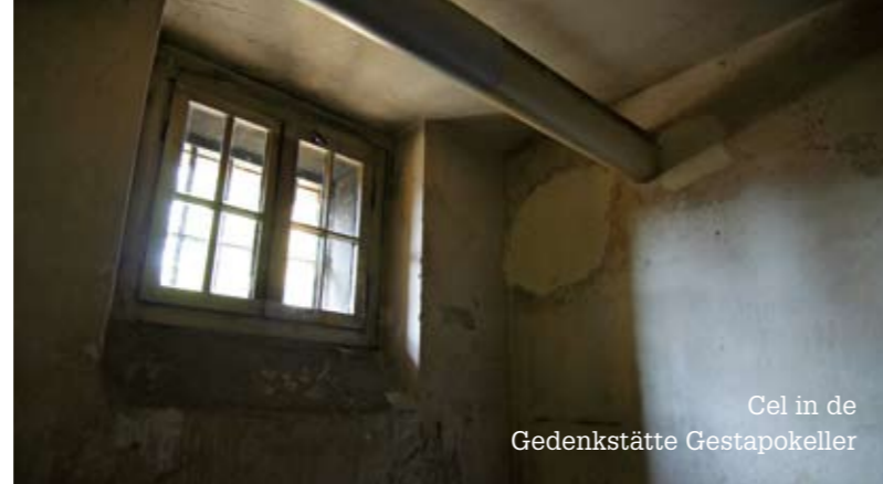
Cell in de Gedenkstätte Gestapokeller

■ In beide gedenkplaatsen zijn publicaties verkrijgbaar over de Gestapo Osnabrück, het AEL Ohrbeck en andere thema's van de tentoonstellingen.