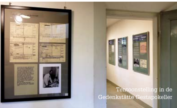
Tentoonstelling in de Gedenkstätte Gestapokeller